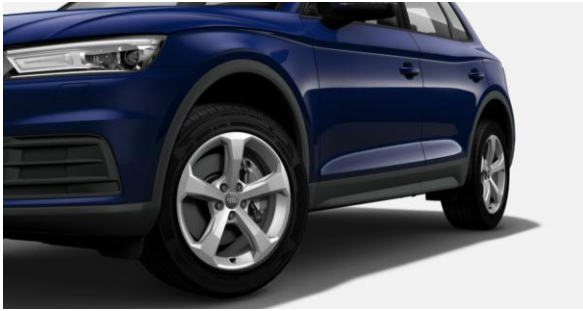
Llanta 18" diseño de 5 brazos 8 J x 18, (235/60 )