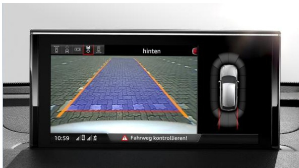
Sistema de aparcamiento delantero y trasero con cámara de retroceso