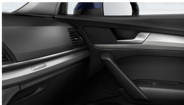
Inserciones interiores en Aluminio