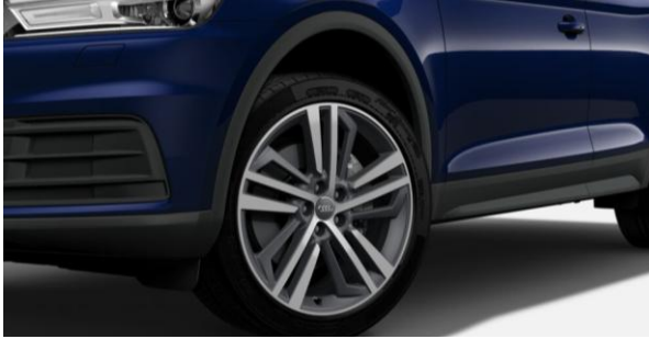
Llantas de aleación 20" de aluminio tamaño 8Jx20