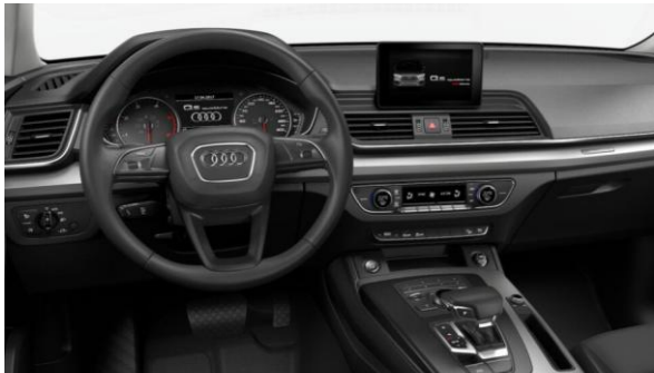
Volante multifunción en cuero, diseño 3 radios