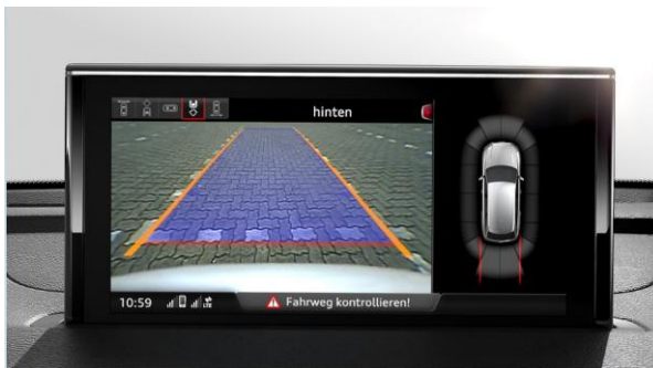
Sistema de aparcamiento delantero y trasero con cámara de retroceso