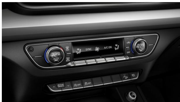
Climatizador automático de 3 zonas