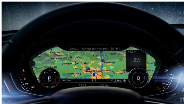
Sistema de navegación Plus y Virtual Cockpit