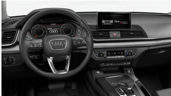
Volante multifunción en cuero, diseño 3 radios