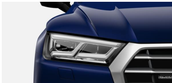
Luces LED con señalizadores posteriores dinámicos