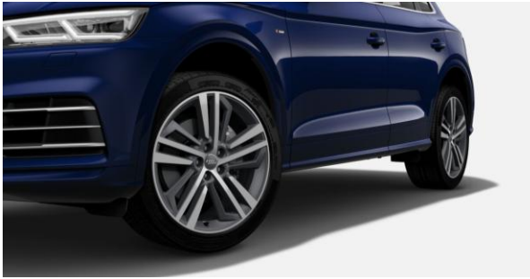
Llantas de aleación de aluminio tamaño 8Jx20